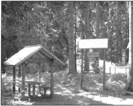
Hladnjak sa drvenim krovom na dvije vode