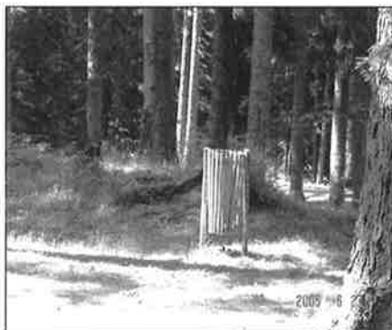
Korpa za smeće

Cijena klupe : 36,45 KM , model na slici