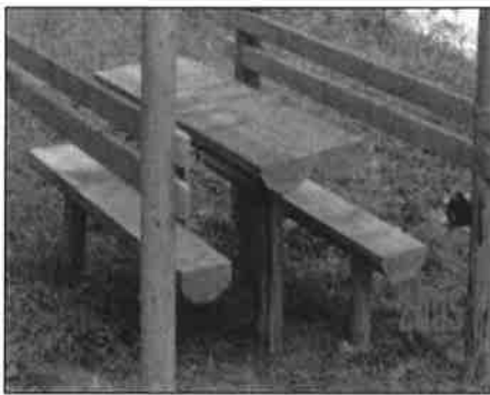
Komplet – sto i klupa