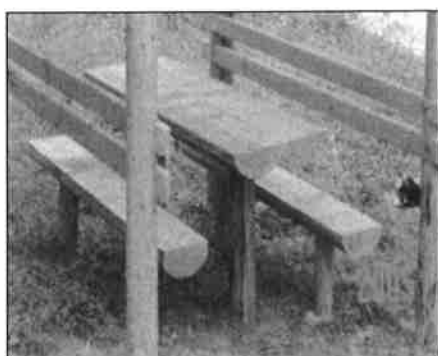
Komplet – sto i klupa