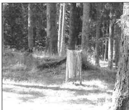
Korpa za smeće

Cijena klupe : 36,45 KM , model na slici