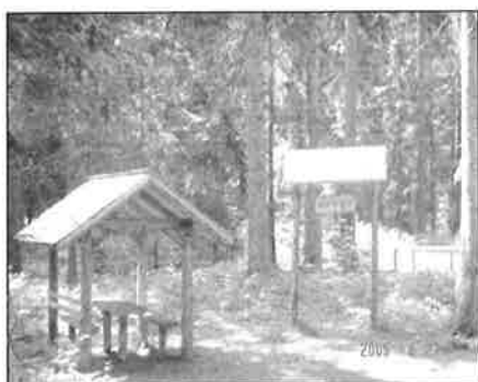
Hladnjak sa drvenim krovom na dvije vode